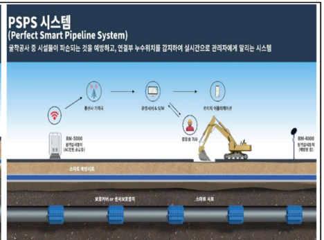
관 파손예방 및 누수감지시스템