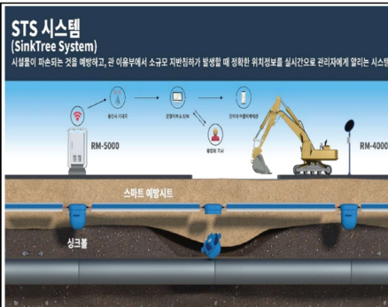
관 파손예방 및 지반침하(싱크홀) 감지시스템